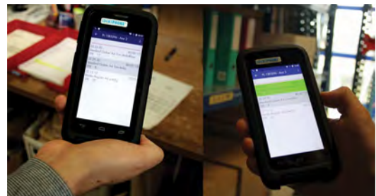
Die Packliste wird von eNVenta auf den Scanner übertragen (links). Der Scan des richtigen Artikels im Lager wird durch den grünen Balken auf dem Display angezeigt (rechts).

Die Android-Scanner repräsentieren – technisch betrachtet – eigene mobile Arbeitsgeräte, die über Webservices mit eNVenta verbunden sind. Gleichzeitig konnte Probyt die grafischen Möglichkeiten von Android für die Gestaltung der Benutzeroberfläche der Scanner nutzen. Die dafür notwendigen Entwicklungen wurden innerhalb von etwa sechs Monaten abgeschlossen.