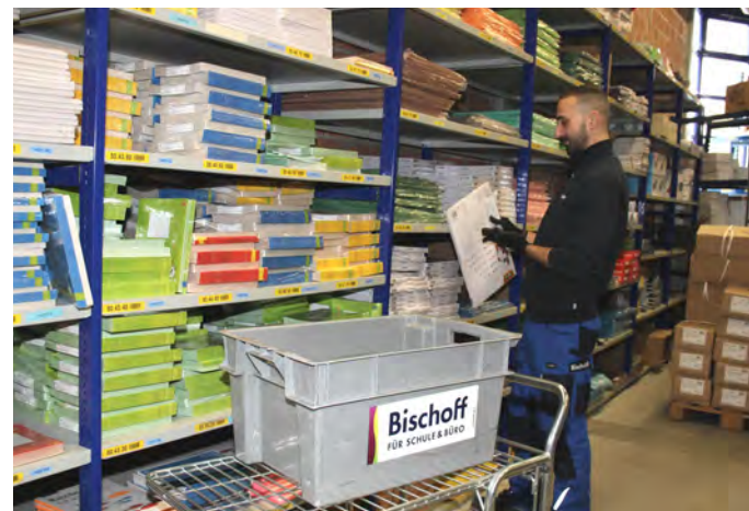
Die Mitarbeiter von Bischoff werden vom Scanner wegeoptimiert durch das Lager geführt.

eNventa ERP ist bereits seit dem Jahr 2012 erfolgreich bei der Bischoff AG im Einsatz. Aufgrund der Digitalisierung konkretisierte sich das Ziel im Unternehmen, die Fehlerrate bei der Kommissionierung im Lager zu senken. Eine Vielzahl kleiner Artikel im Sortiment, wie etwa Filzstifte oder Hefter in vielen Farbvarianten, ist besonders anfällig für Verwechslungen. Diese ziehen eine im Verhältnis zum Warenwert aufwändige Retourenbearbeitung nach sich. Deshalb beauftragte Bischoff seinen IT-Dienstleister Probyt, eine Lösung auf Basis mobiler Scanner zu entwickeln. Die neue Kommissionierungslösung wurde nach einer Testphase in nur zwei Monaten eingeführt.